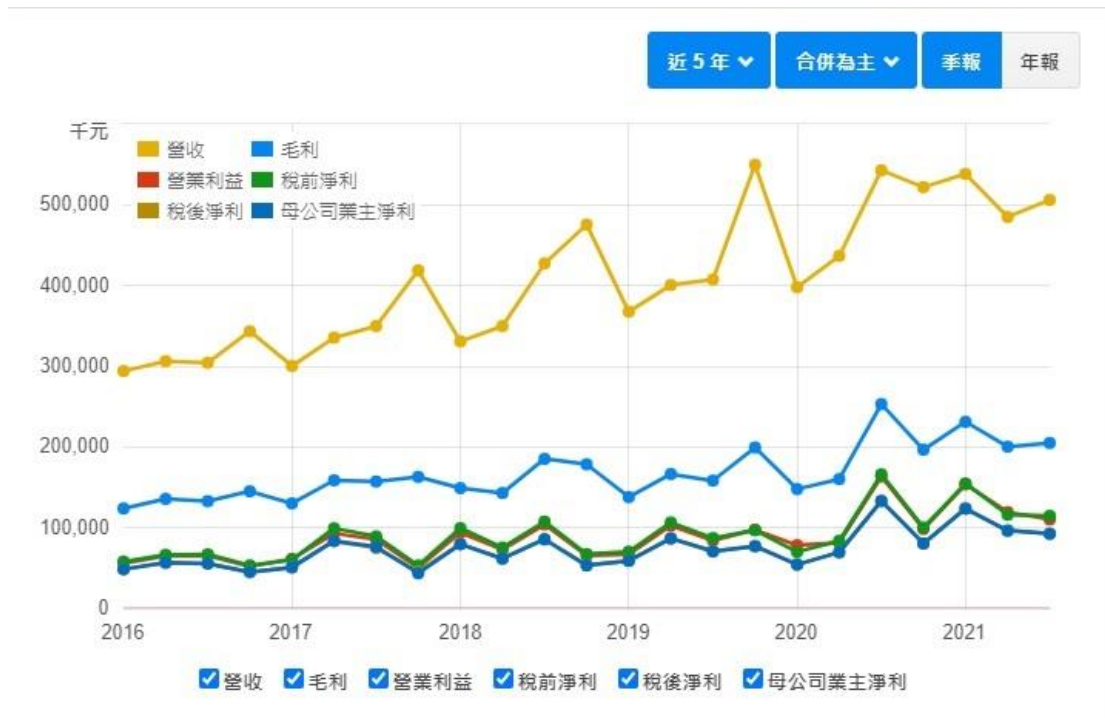
圖一 關貿近 5 年的損益表