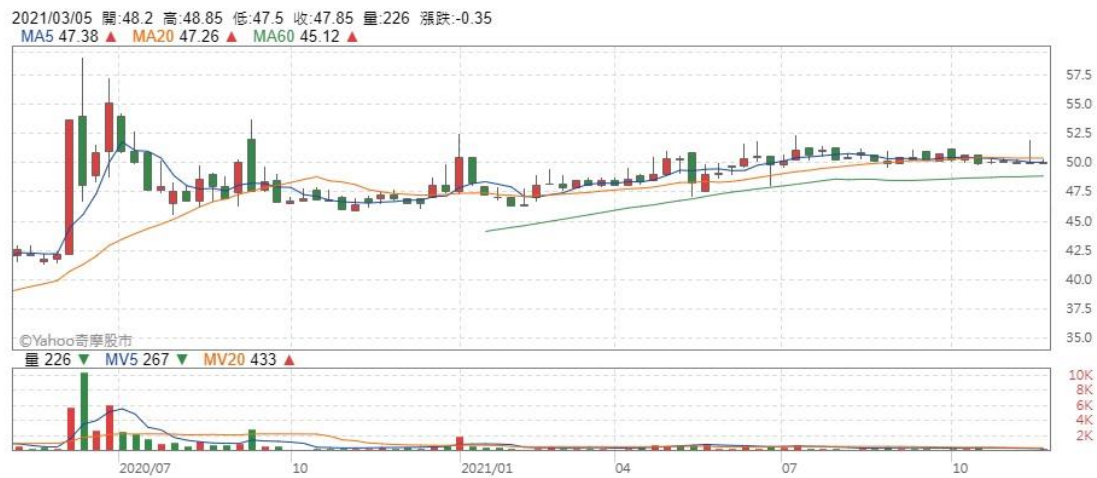
圖六 關貿的股價週線圖