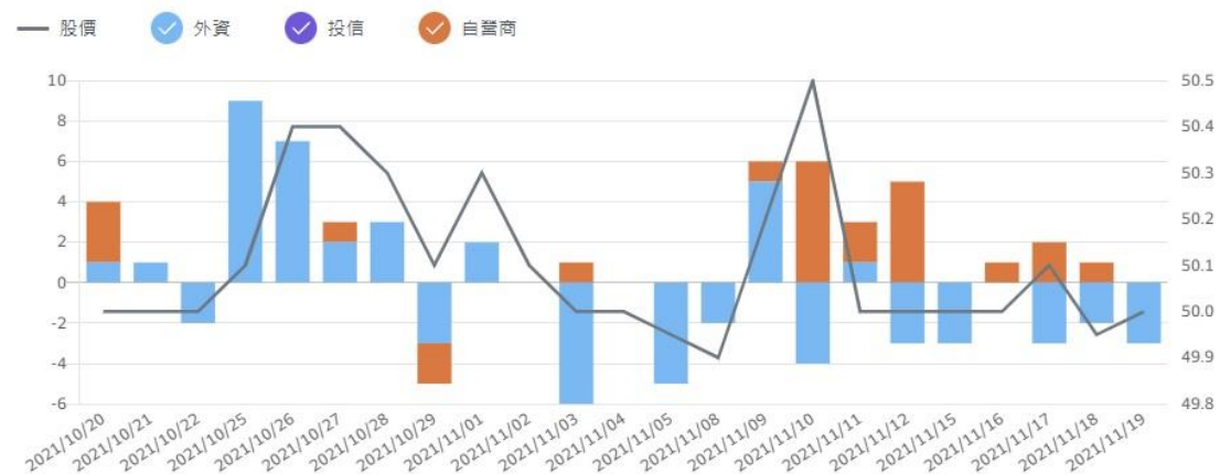
圖四 近一個月關貿的法人買賣超張數

圖四為近 1 個月關貿的法人進出狀況，我們發現該股票法人的進出張數都很少，所以三大法人進出張數對這檔股票並沒有代表性，所以本組決定以董監事的持股比例作為內部人是否看好自家股票的參考依據。