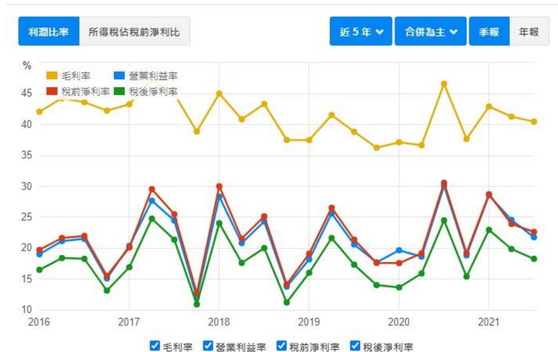
圖三 關貿近 5 年毛利率與淨利率趨勢圖