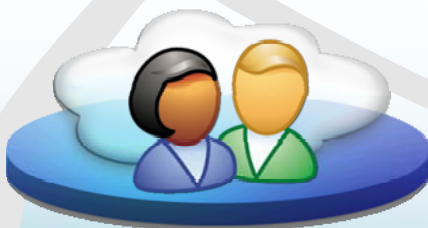
用戶常用內容統計