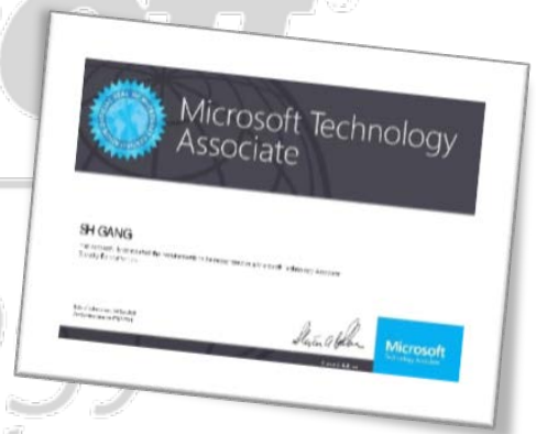
【MTA 原廠國際認證示意圖】